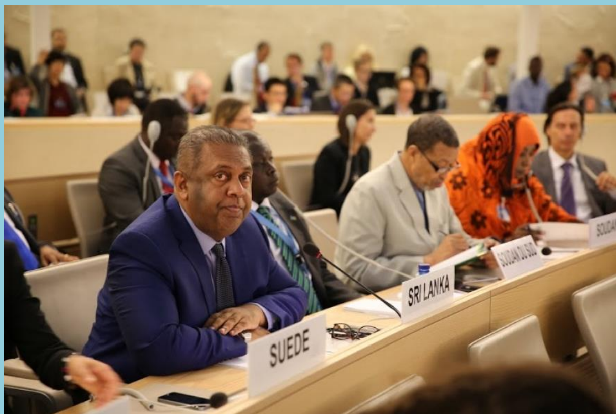
Sri Lankan Foreign Minister Mangala Samaraweera, at the 30th Session of the UNHRC, 14 September 2015, Geneva

Within the first month after winning the parliamentary elections in August 2015, the new Government made a series of commitments related to transitional justice. These were articulated through a speech by the Foreign Minister at the 30th session of the UN Human Rights Council. 1 These commitments were also reflected in the resolution on Sri Lanka that was adopted by the Human Rights Council on 1 October 2015. 2 The resolution came just after the UN High Commissioner for Human Rights had published a report which alleged war crimes and crimes against humanity and other serious violations of international human rights and humanitarian