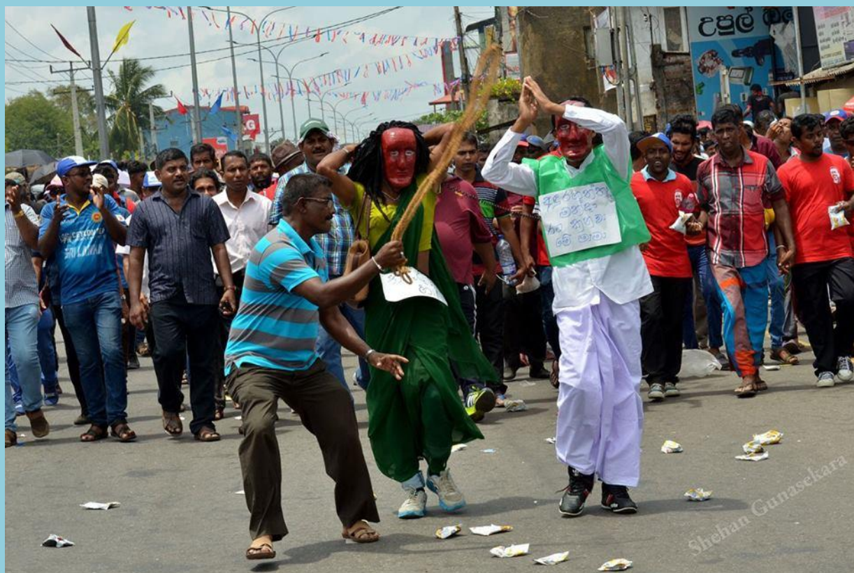
Padayathra protest by the joint opposition

W ommitments to rights are tested mainly in adverse situations. This is true for State as well as non-state actors. As the present government marks one year, despite laudable democratic achievements of the government, cracks have started to appear in the sphere of democratic rights.