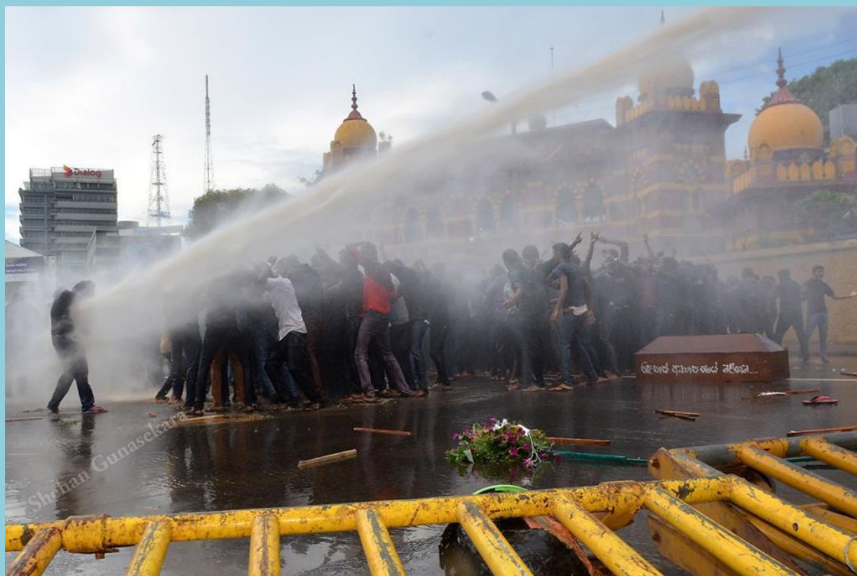
Protest of HNDA students was attacked. 29 th October 2015, near Townhall in Colombo

Notwithstanding the fact that the Rajapaksa led march was aimed at inciting extreme Sinhala nationalist feelings and to sabotage democratic reforms of the government, their right to protest and peaceful assembly should have been respected.