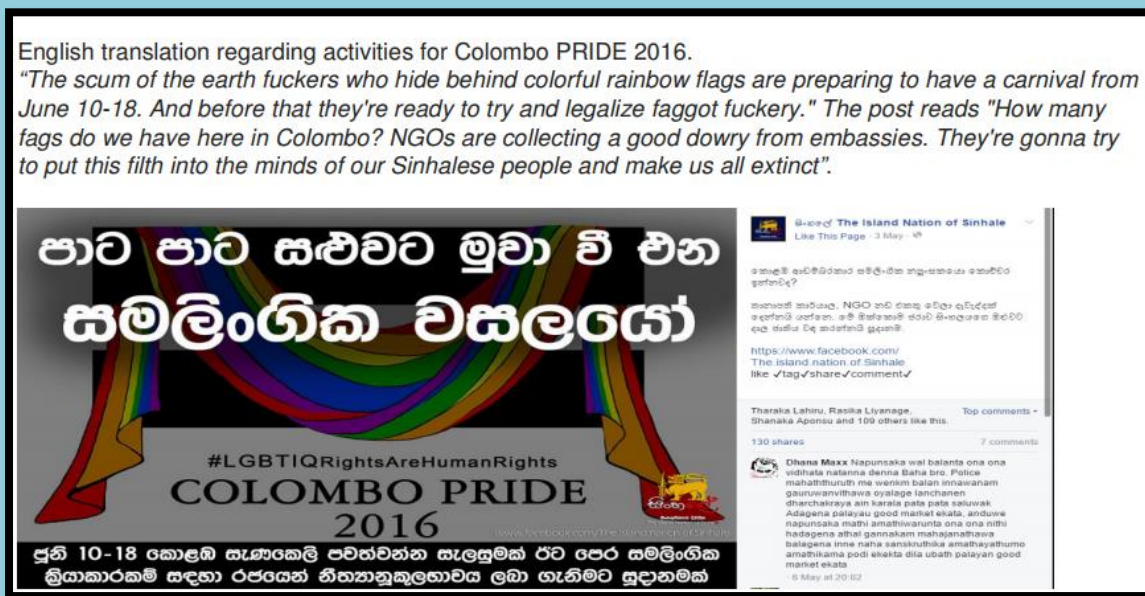
Screenshot of threatening facebook posts made by ‘Island Nation of Sinhale’