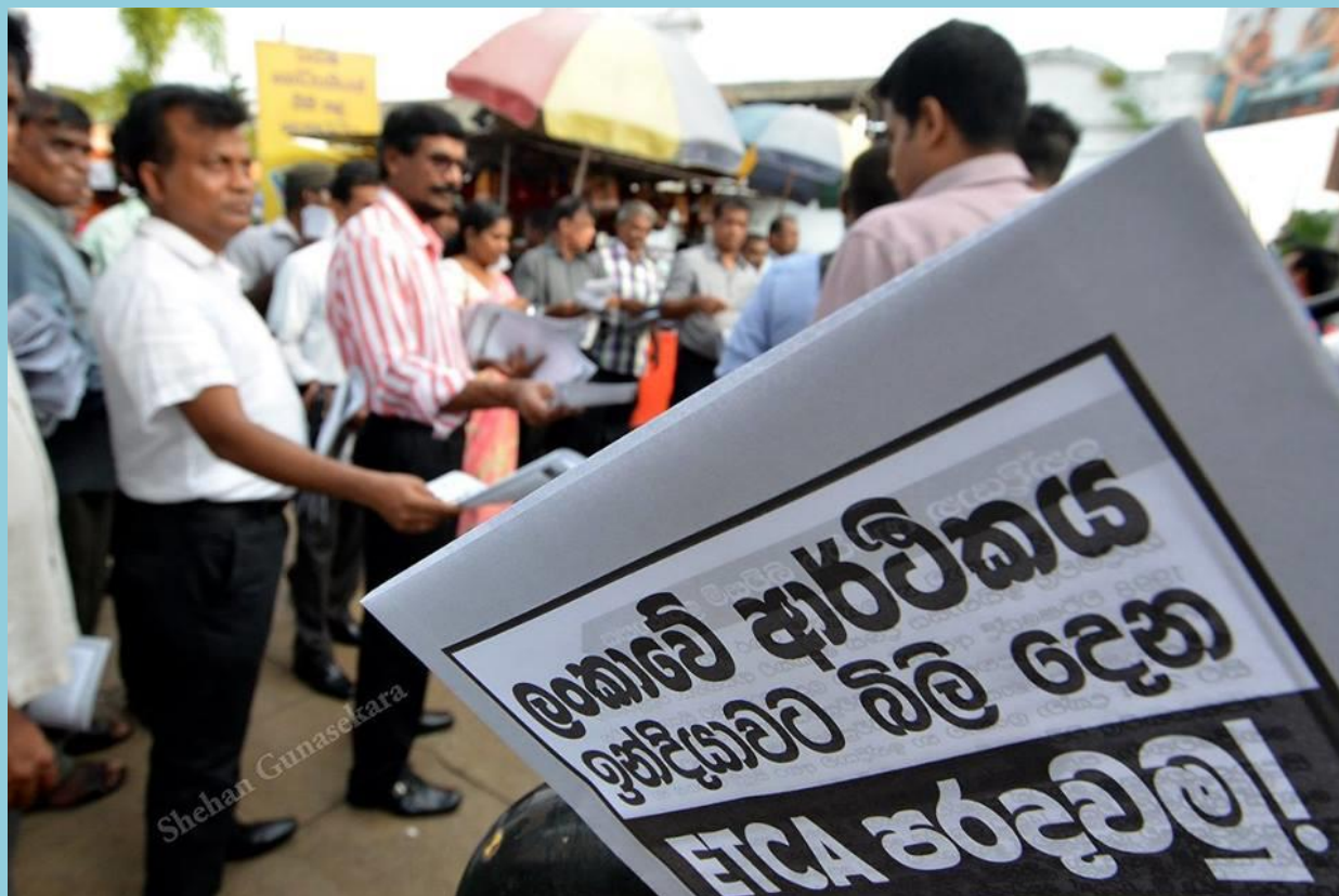
Political party JVP parliamentarians distributing leaflets against Indo-Sri Lanka Economic and Technology Cooperation Framework Agreement (ETCA), 10 th March 2016, in front of Fort Railway Station, Colombo. 10 th March 2016.

R ising living costs, lack of job opportunities for youth, corruption and economic inequality were central economic factors in the defeat of the previous Government in 2015. For the first time in the post-independence Sri Lankan history, the two main political parties have formed a National Government of Consensus since the January 8 th election win. According to Prime Minister Ranil Wickremesinghe, the main objective in forming a National Government is to provide a common platform to deliver long term social and economic solutions that can solve the key problems of the country. 53