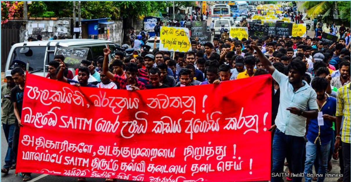
2016/07/27 දින සයිටම් විරෝධී සිසු ජන ව්‍යාපාරය මගින් නුගේගොඩ දී සංවිධානය කල පා ගමන සහ රැලිය.

෧ ක වූ වසරක කාලය ශ්‍රී ලංකාවේ අධ්‍යාපනය සම්බන්ධයෙන් ධනාත්මක වර්ධනයක් පෙන්වූ කාලපරිච්ඡේදයක් ලෙස දැක්විය හැක. එනම් ජනවාරි 8 දින ජයග්‍රහණය කරනු ලැබූ ප්‍රතිපත්තිය පොරොන්දු එක්තරා ප්‍රමාණයකින් ඉෂ්ට කිරීමට වර්තමාන රජය මැදිහත් වීම මෙම කාලය තුළ දක්නට ලැබුණි. කෙසේ නමුත් රාජපක්ෂ රජයේ නිශේධාත්මක අංගයන් ද වර්තමාන රජයේ ක්‍රියාකාරකම් තුළින් යම් ආකාරයකට දක්නට ලැබීමද සැලකිය යුතුය. මෙම ලිපියේ මූලික අරමුණවන්නේ 2015 අගෝස්තු 17 සිට 2016 අගෝස්තු 17 දක්වා වූ වසරක කාලය තුළ අධ්‍යාපනය සම්බන්ධයෙන් වූ සිදුවීම් පිළිබඳ විමර්ශනයක් කිරීමය.