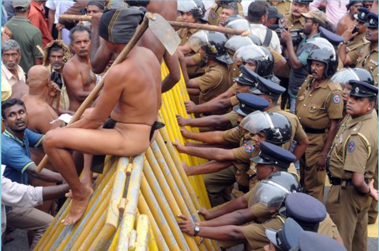
ඡායාරූපය- පොහොර සහනාධාරය නැවැත්වීමට එරෙහිව උද්යෝගයෙන් යෙදෙන ගොවීන්, 2015 දෙසැම්බර් 17 දින කොළඹ අරලිය ගඟ මන්දිරය ඉදිරිපිට.

2015 ජනවාරි 08 වෙනිදායින් පසු මේ රටේ සිදුවූ පරිවර්ථනය සැබෑ ලෙසට රජයක් ලෙස පරිවර්තනය කරනු ලැබුවේ 2015 අගෝස්තු 16 වන දිනයි. එහිදී වසරක ප්‍රගතිය විමසා බැලීමේදී තවදුරටත් රජය අපේක්ෂා කළ හා ක්‍රියාත්මක කළ යුතුව තිබූ ප්‍රධාන අවශ්‍යතා මෙන්ම ජනතාවගේ අභිලාශයන් මුණ ගැසීමට හැකිවූවාද යන්න ප්‍රභල මාතෘකාවක් බවට අද පත්ව තිබේ. විශේෂයෙන් ජනවාරි 08 විප්ලවයෙන් පසු එම ජනතාවාදී න්‍යාය පත්‍රයක් තුළ පොරොන්දු වූ සියළු වගකීම් හා වගවිම්වලින් තොරව අතහැර දමා ඇති බව පසු විමර්ශනය නිසි ලෙස කළ විට හැඟී යනු ඇත. රටක අනාගත වර්ධනය සඳහා හේතු විය හැකි ප්‍රධාන අංශ දෙකක් වනුයේ කෘෂිකර්මය සහ පරිසරයයි. එය දීර්ඝ කාලීන සැලැස්මක් සහිතව පෙර සූදානම් රාශියක් සහිතව සිදුකළ යුතු අඛණ්ඩ ක්‍රියාවලියකි.