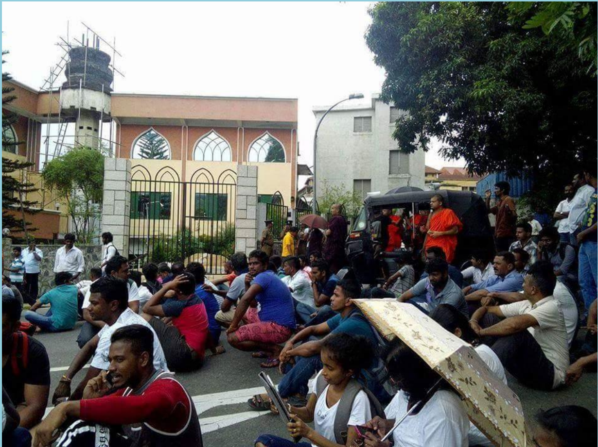
මෙම මුස්ලිම් පල්ලිය මහනුවර දළඳා මාළිගාවට වඩා උසින් වැඩි ලෙස ඉදි කෙරෙන බැවින් එහි ඉදිකිරීම් නවතා දමන ලෙස ඉල්ලමින් විරෝධතාවයේ නියැලුණු ‘සිංහලේ’ සංවිධානය ප්‍රමුඛ බෞද්ධ හික්මුන්. ඔවුන්ගේ විරෝධතාවයෙන් පසුව මෙහි ඉදිකිරීම් නතර කරන ලෙස නියෝගයක් නිකුත් කරන ලදී. 2016, ජුනි 5. මාධ්‍යවේදියා ටේස්ලික් පිටුවෙනි.

ආ ගමික අන්තවාදයන්ගේ වර්ධනය වර්තමානයේ දක්නට ඇති ප්‍රධානතම ගෝලීය ප්‍රවණතාවයකි. ශ්‍රී ලංකාව ද මෙම ප්‍රවණතාවයේ ගොදුරක් බවට පත් ව ඇති රටවල් අතරින් ප්‍රධාන රටකි. ශ්‍රී ලංකාව තුළ මෙය උච්ච ලෙස ප්‍රකාශමාන වූයේ 2014 සිදු වූ අලුත්ගම කෝලහාලය සමඟිනි. එවකට පැවති මහින්ද රාජපක්ෂ රජයේ නිල/නොනිල අනුග්‍රහය යටතේ වර්ධනය වූ බෞද්ධ අන්තවාදී කණ්ඩායම් සමාජ ජාල ඔස්සේ කරන ලද ප්‍රචාරයන් තුළින් මෙම ක්‍රියාව සාධාරණීකරණය කිරීමට උත්සහ දැරීම එකල ඉතා සුලබ සිදුවීමක් විය. මෙම ආගමික අන්තවාදයන්ගේ මතවාද රාජපක්ෂ ආණ්ඩුවේ දේශපාලන න්‍යාය පත්‍රය හා සමපාත වීම තුළ සිදු වූයේ ආගමික සුළුතරය දැඩි පීඩනයකට සහ හිංසනයකට ලක් වීමයි. මේ බව මනාව පැහැදිලිවන්නේ 2015 ජනාධිපතිවරණයේදී සුළු ආගමිකයින් බහුල ප්‍රදේශවලින් මහින්ද රාජපක්ෂ අන්ත පරාජයකට ලක් වීමය. එම මැතිවරණයේදී පොදු අපේක්ෂකයගේ අනපේක්ෂිත ජයග්‍රහණයට කේන්ද්‍රීය සාධකයන් ගෙන් එකක් වූයේ මෙම ආගමික