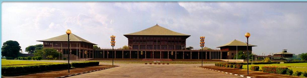
Photograph 1.1 Parliament of Sri Lanka, http://www.president.gov.lk/wp-content/uploads/2016/02/parliament.png

“Since then the parliament which is functioning as a constitutional assembly of all its members lead by a steering committee and several sub committees is said to be debating both the PRC report and other representations and ideas for a new constitution. This process remains under closed doors and thus shrouded in secrecy which in itself goes against the very principles of democratic governance and transparency the public demanded should be firmly enshrined in a new constitution.”