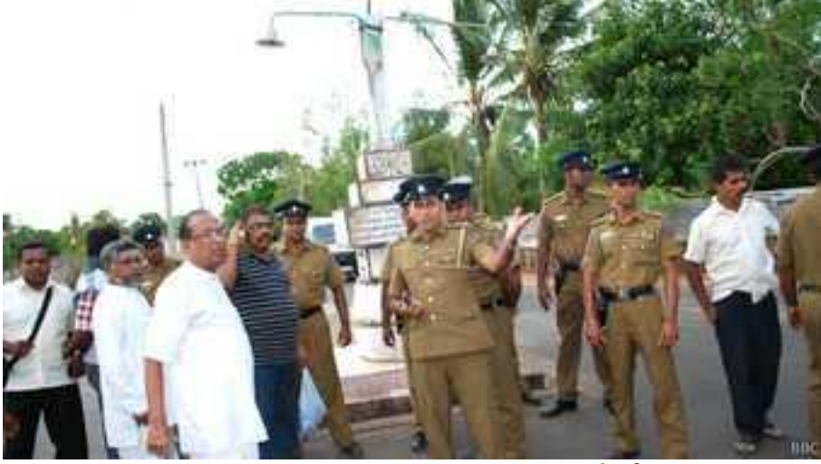
பகுதியில் அமைதிக்குப் பங்கத்தை ஏற்படுத்தும் என்ற காரணத்தினால் நிகழ்ச்சி மீது நீதிமன்றத் தடை உத்தரவைப் பொலிசார் பெற்றனர்

மட்டக்களப்பு மாவட்டத்தில் சத்துருக்கொண்டானில் கொல்லப்பட்ட சிவிலியன்களுக்காக செப்ரெம்பர் 9 அன்று நினைவு தின நிகழ்ச்சியொன்றை நீதிமன்றம் தடைசெய்தது. இத்தகையதொரு நினைவு தினமொன்று “அமைதியைக் குழப்பலாம்” என நீதிமன்றத்திற்கு பொலிசார் கூறியுள்ளனர். கொல்லப்பட்டவர்களுக்கான நினைவுத்தூபியின் விளக்குகளை ஏற்றுவதற்காக தடைசெய்யப்பட்டமை பற்றி தமது கவலையைப் பாதிக்கப்பட்டவர்களின் குடும்பத்தினர் வெளிப்படுத்தினர்.