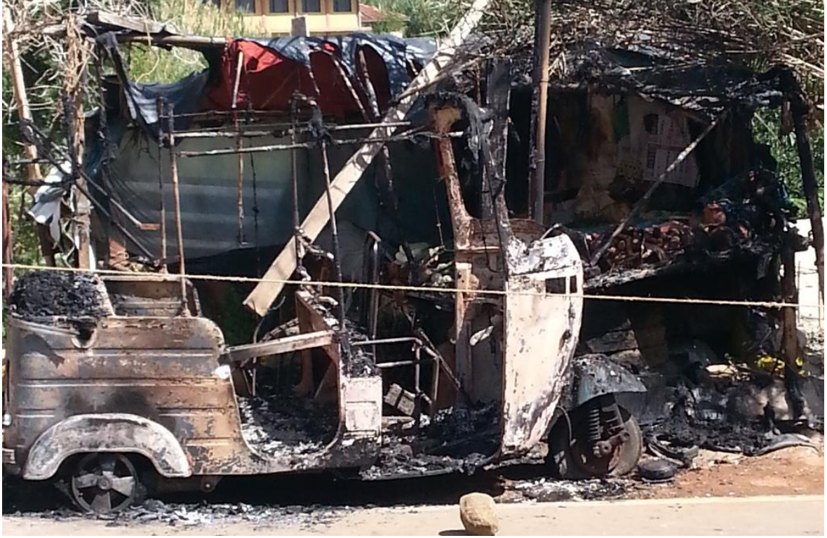
ஊவா மாகாண சபை தேர்தலின் போது எதிர்க்கட்சிகளின் சுமார் 50 தேர்தல் அலுவலகங்கள் தாக்கப்பட்டன (ஐ.தே.க. தேர்தல் அலுவலகமொன்றுக்கு சொந்தமான ஓர் எரியூட்டப்பட்ட முச்சக்கர வண்டி)