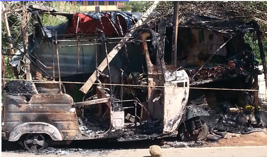
ඌව පළාත් සභා මැතිවරණය කාලයේදී විපක්ෂයේ මැතිවරණ කාර්යාල 50කට පමණ ප්‍රහාර එල්ල විය [එජාප මැතිවරණ කාර්යාලයට අයත් පිළිස්සුණු ත්‍රී වීල් රථය]

http://www.lankatruth.com/home/index.php?option=com_content&view=article&id=7626:vidyaratnas-office-at-his-residence-torched&catid=42:smartphones&Itemid=74