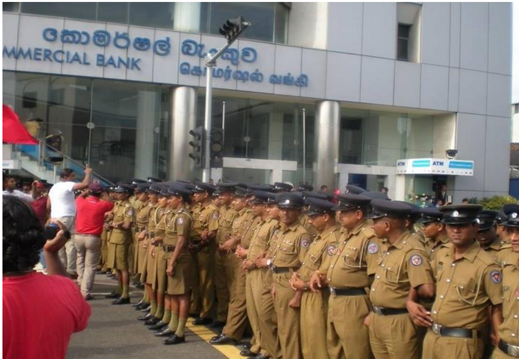
ඒකාබද්ධ වෘත්තීය සමිති සන්ධානයේ මැයි දින රැළිය කොම්පසක්කුවිදිය විදියේදී පොලීසිය විසින් අවහිර කිරීම