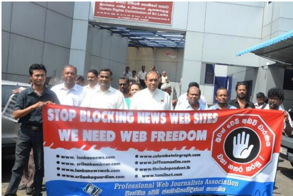
ශ්‍රී ලංකා මානව හිමිකම් කොමිසමට පෙන්සම භාර දීමෙන් පසු ජනමාධ්‍යවේදීන් සහ විපක්ෂයේ දේශපාලනඥයින් ඡායාරූපයකට පෙනී සිටින අයුරු

2005 වර්ෂයේදී පළමු වතාවට ප්‍රචාරණය වූ වෙබ් අඩවියක් වන www.tamilnet.com වෙබ් අඩවිය වාරණය කරන ලදී. ඉන් පසු කාලය තුළ සිංහල, දෙමළ සහ ඉංග්‍රීසි භාෂා වලින් ක්‍රියාත්මක වන වෙබ් අඩවි ගණනාවක් ශ්‍රී ලංකාව තුළ වාරණයට ලක් කර ඇති අතර ඉන් බොහොමයක් රජය පිළිබඳ විවේචනාත්මක ප්‍රචාරණයන් පළ කරන ඒවාය. මේ ආකාරයෙන් රජය විසින් වෙබ් අඩවි වාරණය කිරීම ශ්‍රී ලංකා ආණ්ඩුක්‍රම ව්‍යවස්ථාවට පටහැනි බව ශ්‍රී ලංකා මානව හිමිකම් කොමිසමේ කොමසාරිස්වරයකු මාධ්‍ය වෙත ප්‍රකාශ කර සිටියේය 10 . නමුත් ඉන්ෆෝම් ආයතනයේ දැනුමට අනුව, ඉහත පැමිණිලි කෙරෙන තුරුම මානව හිමිකම් කොමිසම විසින් වසර ගණනාවක් තිස්සේ කෙරී ගෙන යන මේ වෙබ් අඩවි වාරණය සම්බන්ධයෙන් කිසිදු විධිමත් සහ ස්ථාවර ක්‍රියාමාර්ගයක් ගෙන නැත්තේ, මූලික මිනිස් අයිතිවාසිකම් කඩවීම් සම්බන්ධයෙන් සිය ස්වාධීන අභිමතය පරිදි විමර්ශන ආරම්භ කිරීමට, මූලික මානව හිමිකම් කඩවීම් සම්බන්ධව රජයට සිය නිගමනයන් නිල වශයෙන් භාර දීමට, වෙබ් අඩවි ලියාපදිංචි කිරීම වැනි කාරණා ව්‍යවස්ථාවිරෝධී බවට රජයට උපදෙස් දීමට ආදී කරුණු සම්බන්ධයෙන් කටයුතු කිරීමට ශ්‍රී ලංකා මානව හිමිකම් කොමිසමට නිල වශයෙන් බලය ලබා දී තිබිය දීය.