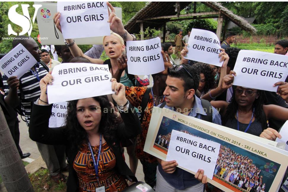
මාධ්‍ය හමුව පැවැත්වීම තහනම් කිරීම පිළිබඳව ජාත්‍යන්තර නියෝජිතයන් විසින් තරුණ සමුළුවේදී කළ විරෝධතාවය. 2014 මැයි 09.

"මොවුන්ට යටි අදහසක් තිබෙනවා. ඒ වගේම මේ සිදුවීම තරුණ සමුළුවට අදාළත්වයක් නැහැ. එම නිසා මෙම මාධ්‍ය හමුවට අපි ඉඩ දිය යුතුයි මම හිතන්නේ නෑ." යනුවෙන් අමාත්‍යවරයා මාධ්‍යයට පැවසූ බව වාර්තා විය. "මෙය අපේ වැඩසටහන. ලෝකය අපේ තත්ත්වය ගැන දැන ගන්න ඕනේ. ඒ වගේම මේ අසාධාරණය පිළිබඳව ප්‍රචාරය කිරීමට අපි බලාපොරොත්තු වෙනවා". යනුවෙන් තරුණ නියෝජිතයෝ ප්‍රකාශ කළහ. සමුළුවට පැමිණි නියෝජිතයන් කණ්ඩායමක් විසින් 'Bring back our girls' යනුවෙන් සටහන් වූ පුවරු රැගෙන අමාත්‍යවරයාගේ තීරණයට විරුද්ධව විරෝධතා ව්‍යාපාරයක්ද පවත්වන ලදී.