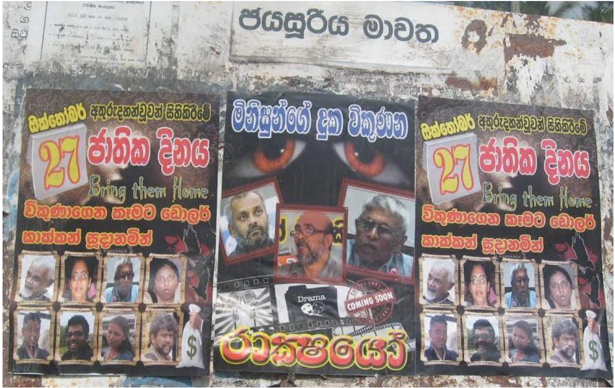
நீர்கொழும்பிலும், கொழும்பிலும் மனித உரிமை காப்பாளர்களைக் குற்றஞ்சாட்டி ஒட்டப்பட்டிருந்த சுவரொட்டிகள்