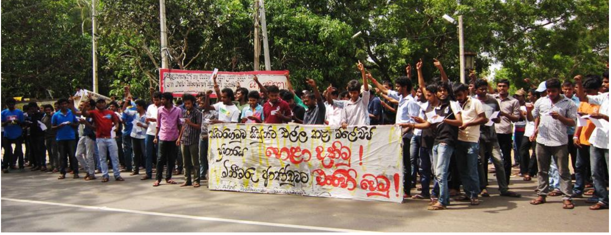
தாக்குதலின் பின்னர்: களனி பல்கலைக்கழகத்தினதும், ரஜரட்டை பல்கலைக்கழகத்தினதும் மாணவர்கள் எதிர்ப்புக்களை மேற்கொள்கிறார்கள்

ஒக்ரோபர் 10 இரவு வேளை, பதுளை-கொழும்பு வீதியில் பம்பஹின்ன சந்தியில் சத்தியாக்கிரக இயக்கமொன்றில் பங்கெடுத்த சப்ரகமுவ பல்கலைக்கழகத்தின் மாணவர்கள் பெற்றோல் குண்டுகளுடனும், குறுந்தடிகளுடனும் ஆயுதபாணியிலான முகமூடி அணிந்த கும்பலினால் தாக்கப்பட்டனர். தாக்குதலைத் தொடர்ந்து 20க்கு மேற்பட்ட மாணவர்கள் காயமடைந்ததுடன், பம்பஹின்ன கிராமிய வைத்தியசாலையில் 13 பேர் அனுமதிக்கப்பட்டனர். இதில் 6 பேர் பின்னர் பலாங்கொடை ஆதார வைத்தியசாலைக்கு இடமாற்றப்பட்டனர். அரசாங்கத்தினால் நிருவகிக்கப்படும் பல்கலைக்கழகங்களில் பல்கலைக்கழக மாணவர் சங்கங்களை நீக்குவதை எதிர்த்தே சத்தியாக்கிரகத்தை மாணவர்கள் ஆரம்பித்திருந்தார்கள். பலதரப்பட்ட சம்பவங்களில் மாணவர்களை இடைநிறுத்தியதையும், மனித உரிமைகள் ஆணைக்குழுவின் பரிந்துரைகளை அமுல்படுத்தப்படாததையும் எதிர்த்தே சத்தியாக்கிரகம் ஒழுங்குபடுத்தப்பட்டிருந்தது.