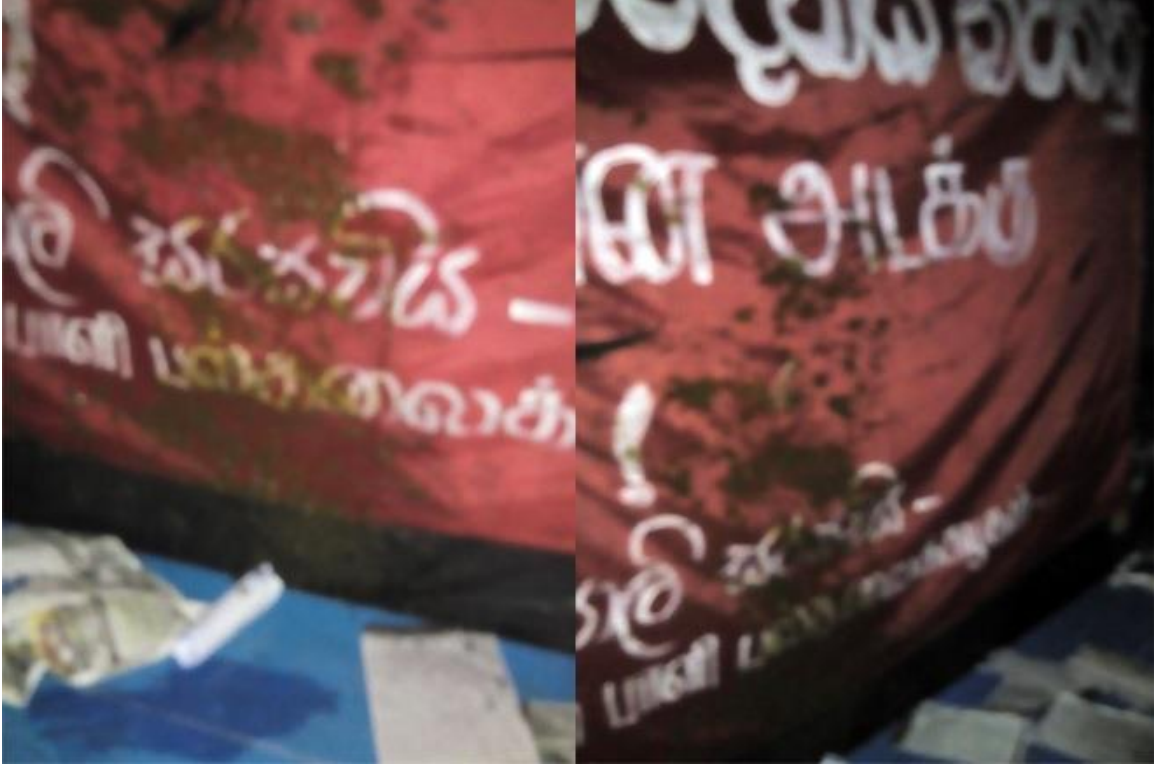
சில மாணவ பிக்குகள் மீது தாக்குதல் நடத்தியோர் பயன்படுத்தப்பட்ட எஞ்சின் எண்ணெயை எறிந்தனர்

எதிர்ப்பிலான உண்ணாவிரதத்தில் ஈடுபட்டிருந்த பெளத்த மற்றும் பாளி பல்கலைக்கழகத்தின் மாணவ பிக்குகள் அடையாளம் காண முடியாத குழுவொன்றினால் தாக்கப்பட்டனர். தாக்குதல் நடத்தியோர் சில மாணவ பிக்குகள் மீது பயன்படுத்தப்பட்ட எஞ்சின் எண்ணெயை எறிந்தனர். உண்ணாவிரதம் ஆறு வாரங்களுக்கு மேல் நடந்து கொண்டிருந்தது. தாக்குதலுக்கு எதிராக ஹோமாகமவில் போராட்டமொன்று நடத்தப்பட்டது. கல்வி வசதிகளையும், தரங்களையும் மேம்படுத்துவதற்கு 10 கோரிக்கைகளை உண்ணாவிரதம் அடிப்படையாகக் கொண்டிருந்தது.