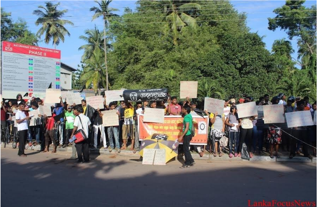
தொழிற்சங்க செயற்பாட்டாளர்கள் மீதான தாக்குதல்களுக்கு சுதந்திர வர்த்தகவலய ஊழியர்கள் எதிர்ப்பு தெரிவிக்கின்றனர் (LankaFocusNews photo)

http://lankafocusnews.com/?p=30536 - சிங்களத்தில் (கடைசியாக நொவ. 22 அன்று கையகப்படுத்தப்பட்டது)